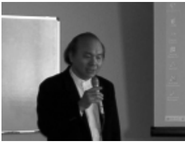
講演する大川理事長。悪徳リフォームから欠陥住宅の事例まで幅広くフォロー。

施設で、地域で活動している市民団体やNPOを支援する場所です。「パレットフェスタ」は、そんな団体の活動を報告しアピールする催し物です。「建築Gメンの会」も「西部地域交流プラザ・パレット」の登録団体となり、昨年の「パレットフェスタ2002」に引き続き、今年も参加致しました。今年は、佐藤理