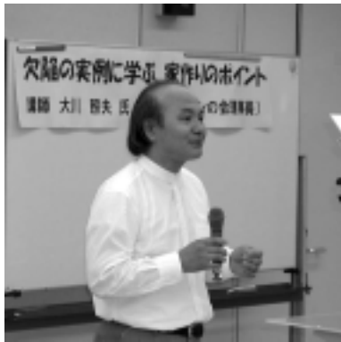
拳を握って力説する大川理事長