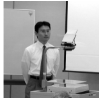
真剣な面持ちで壇上に立つ中山事務局長