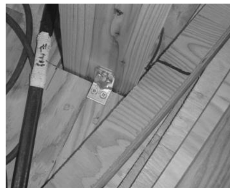
取付けビスが間違っている