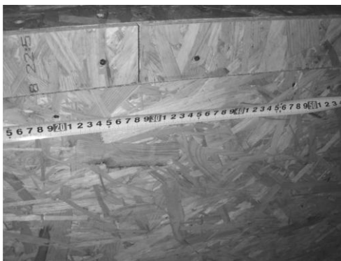
当該箇所の釘間隔は 150 mm以内でなければならないが、実際は 250 mm以上となっている