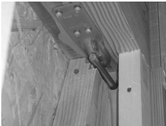
筋かいの欠き込み(別な箇所)

その現場の大工さんは「筋かいの欠き込みをしてはならない」との建築基準法令を無視し、筋かいを欠き込みしても「しようがない」と言っています。是正をしなかったのです(後に請負業者の社長も同じ考えを持っていたことが分かった)。その上「検査の人が見逃してくれば助かる」「これぐらいで家が倒れることはない」などと考えている、最悪ともいえる大工だったのです。当然、実際の検査の際には欠き込みをした筋かいの箇所は不合格になり、是正が必要になりました。この時には、請負業者の社長さえも検査員に対して「そんな細かいことを指摘されたら、建築なんかやってられねーや」と食って掛かる始末です。明らかに最悪の組み合わせです。後に洩々、この箇所は是正を行いました。