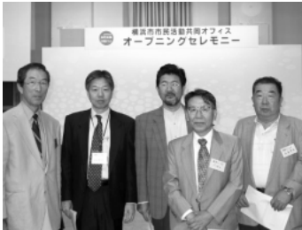
横浜市民活動共同オフィスオープニングセレモニーにて

横浜グループの活動としては、2001 年 8 月の横浜市開港記念会館における第一回目の講演会と無料相談会開催が皮切りでした。それから定期的に会合を重ね、勉強会や業務の情報交換などを行ってまいりましたが、2002 年 5 月頃、活動拠点の必要性を感じていた折、新聞記事から横浜市民活動共同オフィスの入居者募集を知り、渡りに船とばかりに申し込み、同年 9 月から入居することに。期間は一年間。