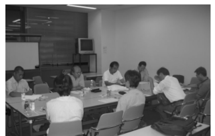
東京地区連絡会風景(7/28)