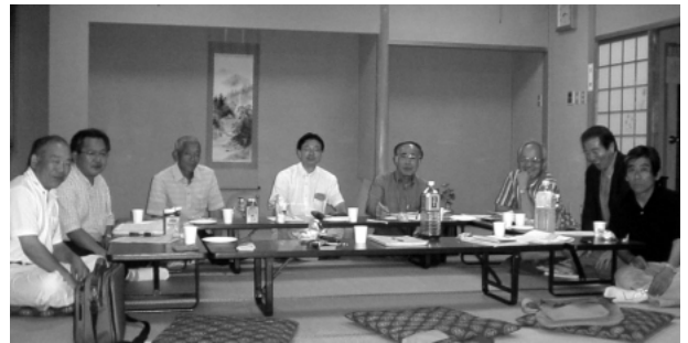
＜千葉グループ会合風景

プではその準備のため定期的に会合を開き、各役割分担を決め、宣伝活動等に努力してまいります。今回の開催は千葉グループとして第4回目となり、今までの開催