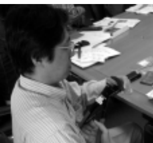
左：圧接コ ネクタによ るFケーブル の接合の 実践