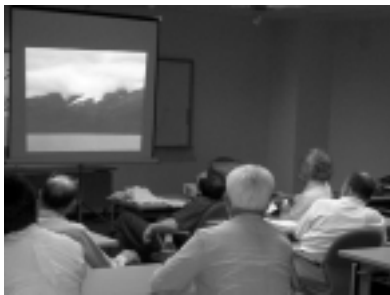
豊富な写真を使って、講演は進められた