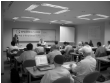
定例総会開催風景