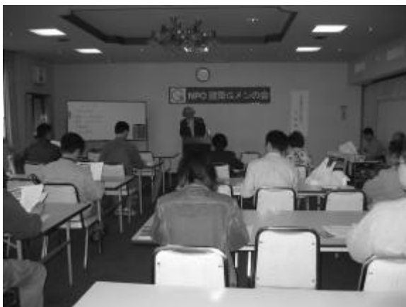
4月20日(日)、さいたま市の埼玉