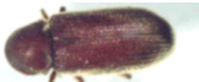
オオナガシンバムシ