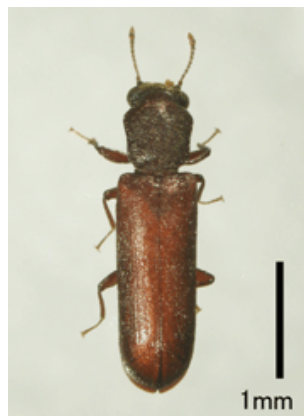
ヒラタキクイムシ