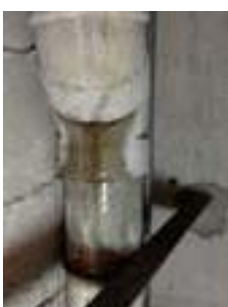
上部配管の荷重に耐え切れず、割れた継手