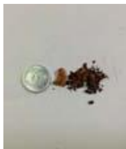
リノベーション後、水栓器具手前に詰まっていた錆