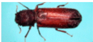
オオナガシンクイムシの一種