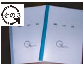
鑑定書・調査報告書の作成