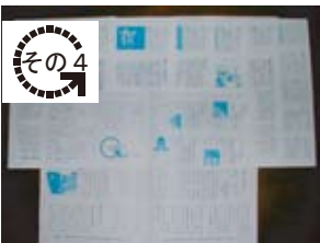
情報発信(会報「楔」の発行)