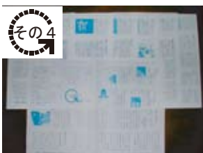
情報発信(会報「楔」の発行)