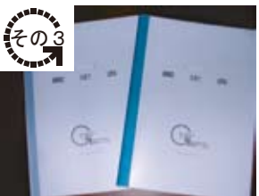
鑑定書・調査報告書の作成