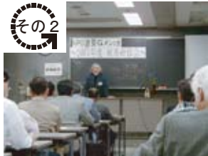
検査技術者(建築Gメン)の育成