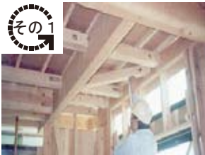
建物の調査・検査