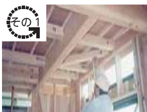
建物の調査・検査