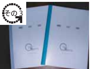
鑑定書・調査報告書の作成