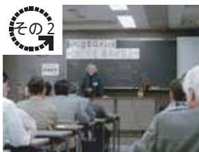
検査技術者(建築Gメン)の育成