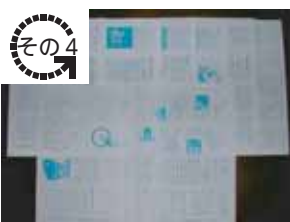
情報発信(会報「桜」の発行)